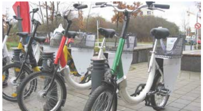
Velostation Vel'OK virun der Résidence Waassertrap (CIPA) op der Marcelle Cornette-Lentz Plaz