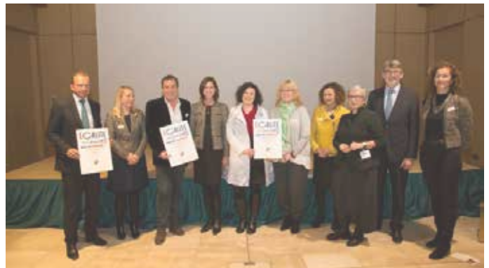
Remise vum Label "Egalité dans ma commune"